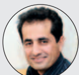
Winay Camaly Systemutveckling