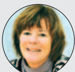
Inger Björå Systemutveckling