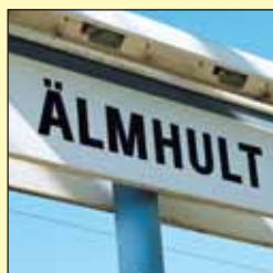
Stockholm tur och retur