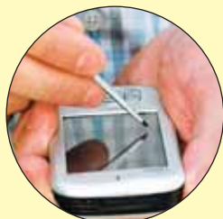
Kontoret på fickan