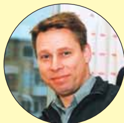
KLARTEXT ny bransch för Urban

Nyhetsbladet i Klartext Advokatsystem ges ut av SoftIT SK AB Ansvarig utgivare: Bo Myrén Besöksadress: Esplanaden 3D, Sundbyberg Box 1252, 171 24 SOLNA Tfn: 08-705 80 10 Fax: 08-705 80 55 hemsida: www.softit-sk.se i Klartext produceras av: Ulf Hansson Text & Bild och Text å Form AH AB