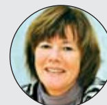
Inger Björå Systemutveckling