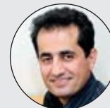
Winay Camaly Systemutveckling