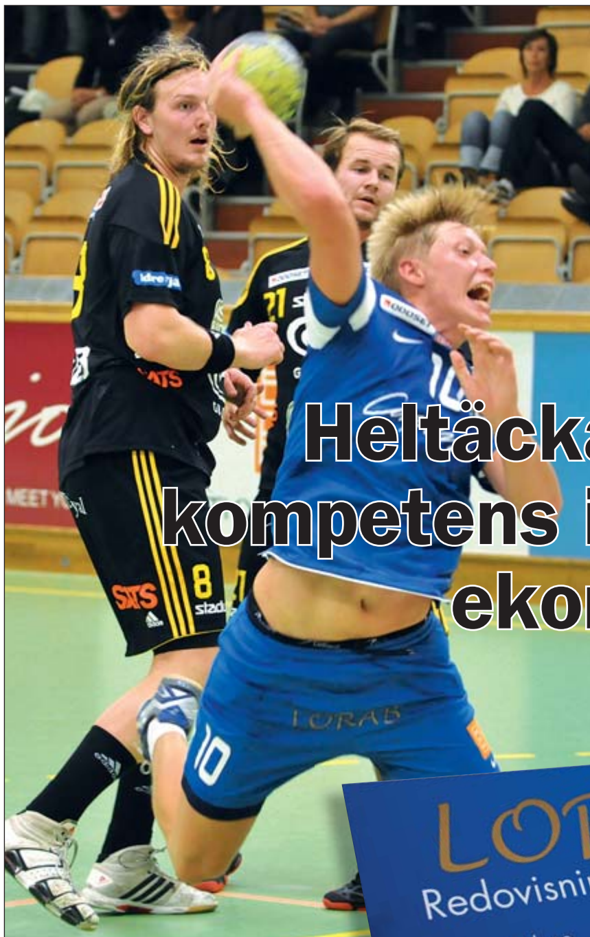
Av: Ulf Hansson

Nyhetsbladet i Klartext Advokatsystem ges ut av SoftIT SK AB Ansvarig utgivare: Bo Myrén Adress: Starrbäcksgatan 1 172 74 SUNDBYBERG Tfn: 08-705 80 10 Fax: 08-705 80 55 hemsida: www.softit-sk.se i Klartext produceras av: Ulf Hansson Text & Bild och Text å Form AH AB