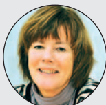
Inger Björå Systemutveckling