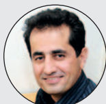
Winay Camaly Systemutveckling